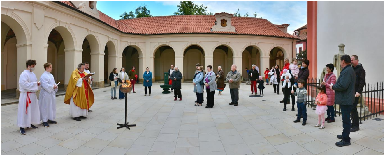
Ilustrační foto z „malé Bílé soboty“ Stará Boleslav

Nemohli jsme v neděli do kostelíčka... ale slavili jsme domácí bohoslužbu, celá rodina pospolu jako už dlouho ne, když každý obvykle musí na mši jindy, aby stihl další domluvené povinnosti či radosti.